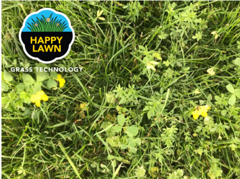
Happy Lawn zonder NPK in de zomer

Onze maaibare bloemen zijn niet alleen een lust voor het oog; ze zijn ook vriendelijk voor je planning. In tegenstelling tot traditionele gazons of openbare groene ruimtes die frequent maaien en bemesten vereisen, zijn de bloemen in Happy Lawn het toonbeeld van onderhoudsarme elegantie. Ze floreren met minimaal water en voedingsstoffen, waardoor je je gazon kunt opvrolijken terwijl je zowel tijd als moeite bespaart.