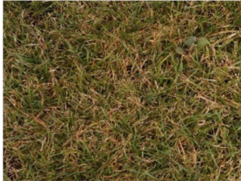
Gazonmengsel zonder NPK in de zomer